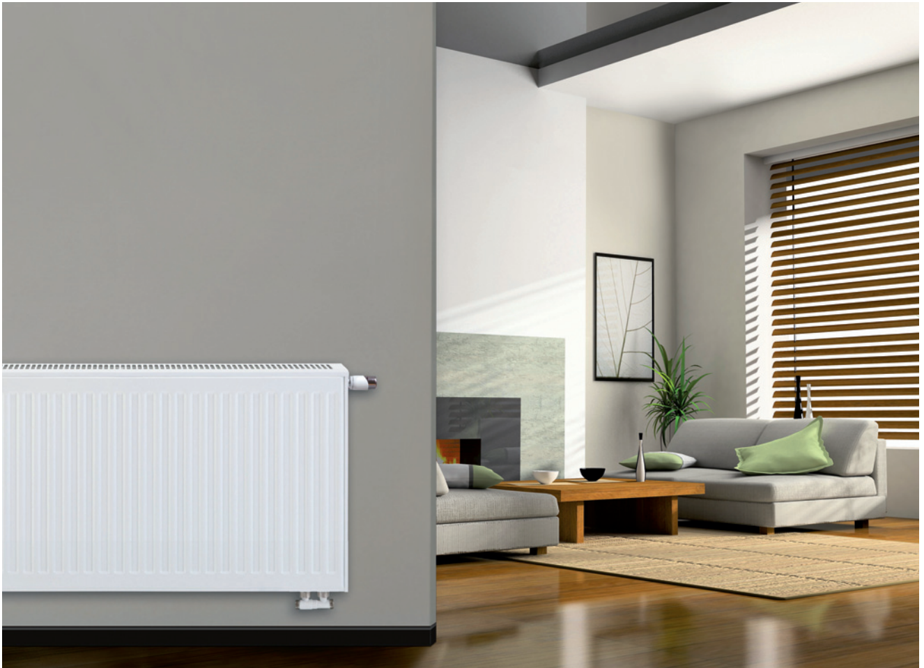
Univerzálne vykurovacie teleso Vitotset