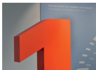
Partner odborných remesiel č. 1 – po 15. raz za sebou

Vytvárame životný priestor pre budúce generácie.