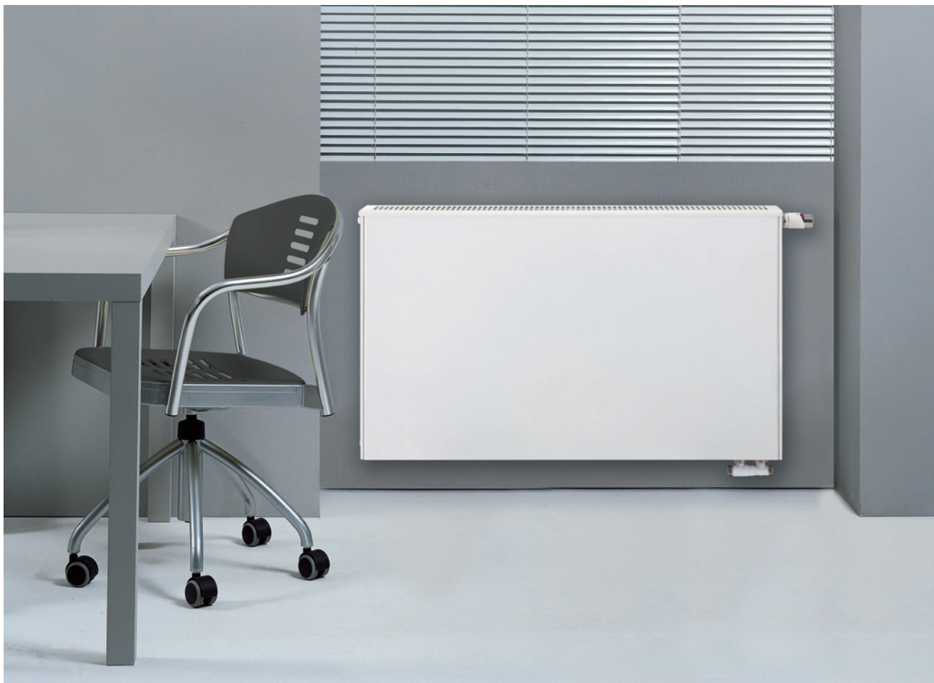
Univerzálne ploché vykurovacie teleso Vitotek