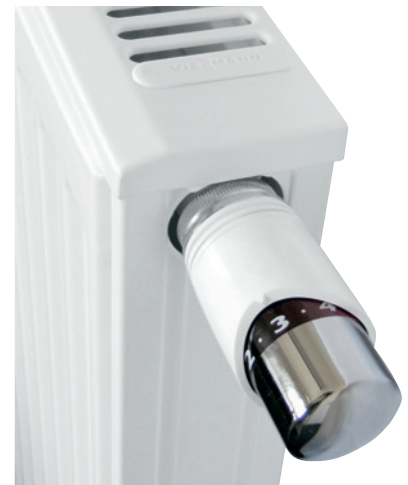
Univerzálne vykurovacie telesá s termostatickou hlavicou

Vďaka snímateľnej dizajnovej krycej mriežke môžete vykurovacie telesá kedykoľvek dôkladne vyčistiť a preto sú vhodné aj pre alergikov.